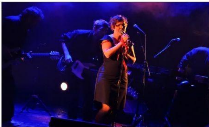
Prévert chanté par AV Marianne, c'est sexy en diable

Mais comment donc ? Du rock pour distiller Prévert ? Parfaitement ! Et ce n'était d'ailleurs pas que de la musique, c'était du théâtre, c'était de la poésie, c'était la vie écrite en noir et blanc et contée en couleurs. Les sardinières d'antan, exploitées par le patron, n'ont pas pris une ride (« Vous vivrez malheureuses et vous aurez beaucoup d'enfants, qui vivront malheureux »). Le désespoir sur un banc public, assis là à ne pas savoir que faire, à le même goût amer. Les textes ont une résonance actuelle,